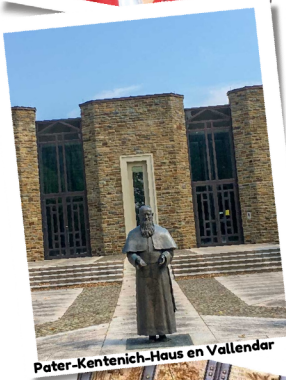
Pater-Kentenich-Haus en Vallendar