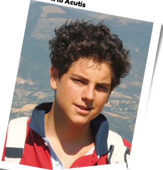
Beato Carlo Acutis